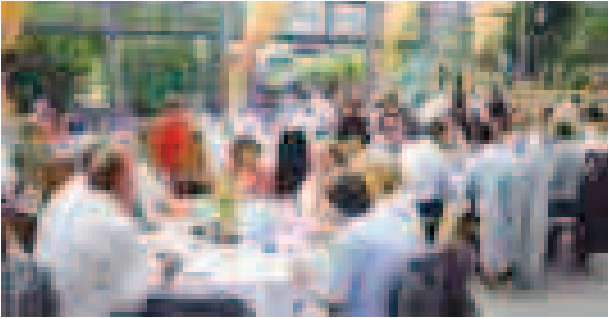
Gute Gespräche mit den Abgeordneten des Landtages im gärtnerisch gestalteten Parkcafé des Blühenden Barocks.

Public Viewing“ bei den Gärtnern wird den Abgeordneten somit lange in Erinnerung bleiben.